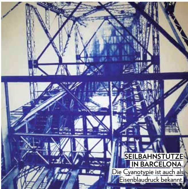
SEILBAHNSTÜTZE IN BARCELONA.

Die Cyanotypie ist auch als Eisenblaudruck bekannt.